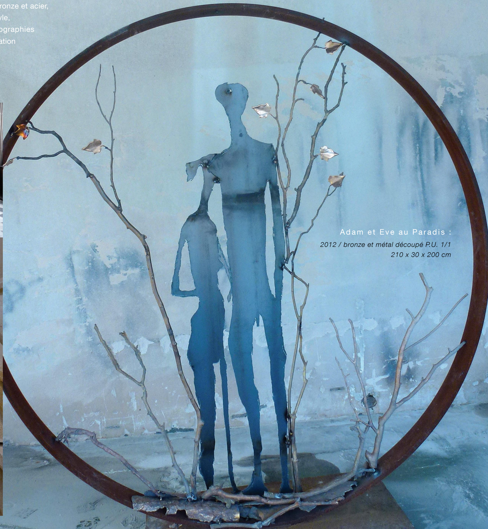
Adam et Eve au Paradis : 2012 / bronze et métal découpé P.U. 1/1 210 x 30 x 200 cm